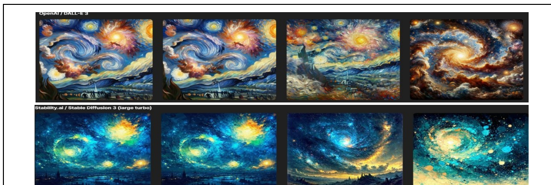
< 生成 AI の見本 1:ビッグバンのエネルギーとカオス的な空を、ゴッホ風のダイナミックなタッチと鮮やかな色彩で表現>