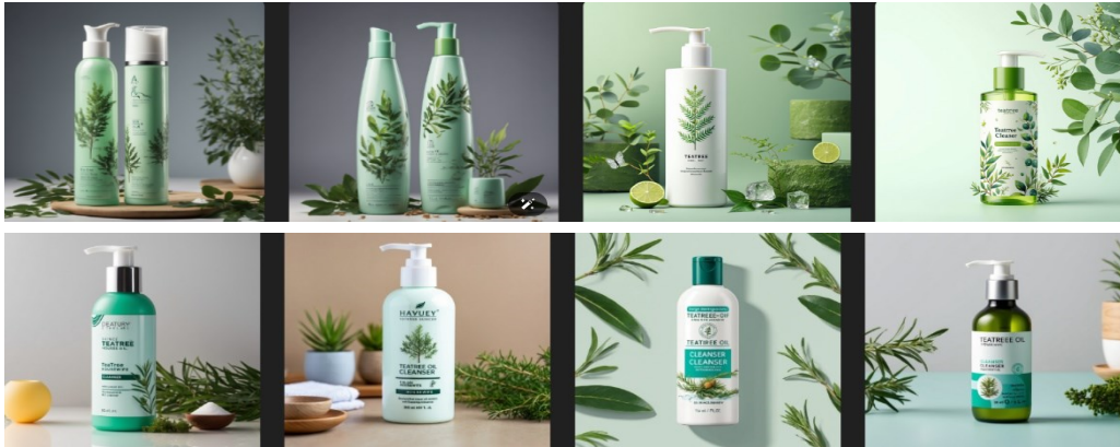
＜生成 AI の見本 2:ティーツリーオイル配合のクレンジングフォーム容器のデザインで、30 代女女性が使用するのに適したイメージで表現＞