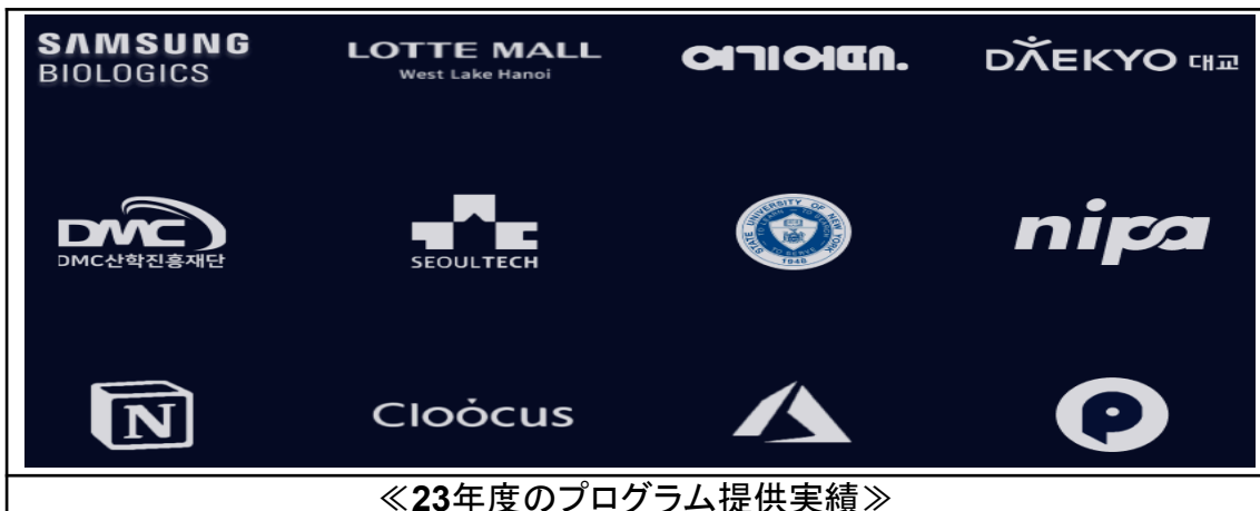
《23年度のプログラム提供実績》