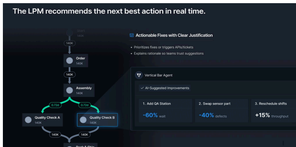
< LPMは、最適な改善を定量定量化 >