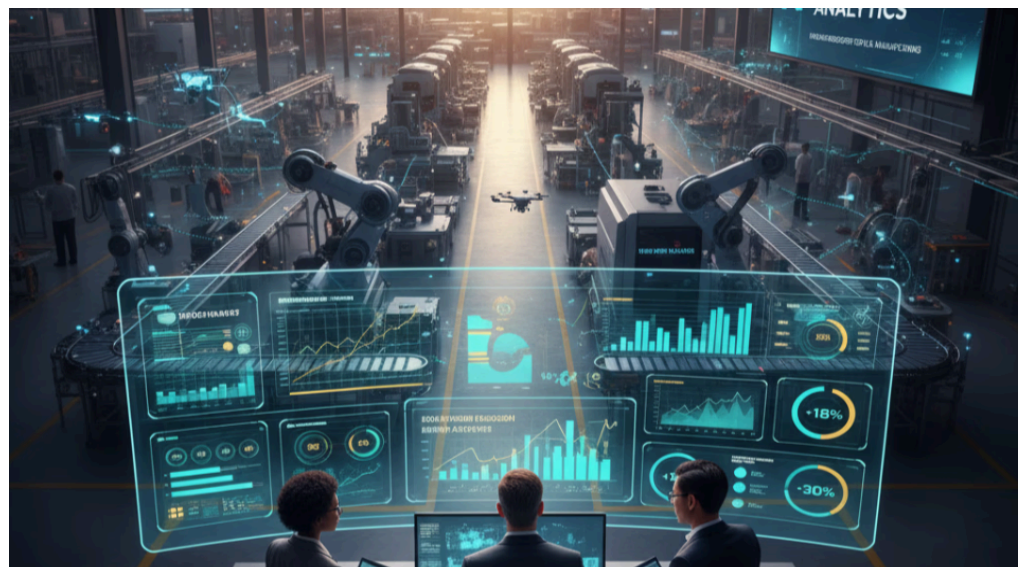
< NetSuite 製造分析…>